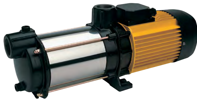
Tabla de características